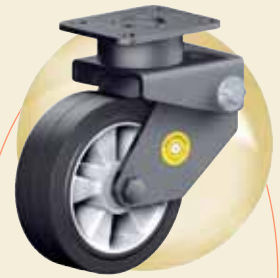
UMWELTBEWUSST: Rollenbau hat die Auszeichnung ÖkoBonus.

Seit März 2009 hat Rollenbau die Auszeichnung ÖkoBonus für umweltbewusste Optimierungen im Unternehmen. So wurde beispielsweise der neue Katalog mit einer Auflage von 20.000 auf Papier mit dem FSC-Warenzeichen gedruckt. Rund 700 zusätzliche Produkte finden sich im aktuellen Katalog. Insgesamt geht das Angebot des mittlerweile seit 35 Jahren bestehenden Familienunternehmens an Rädern und Rollen über mehr als 10.000 Produkte von 8 kg bis 50 t Tragkraft. Neben den Produkten gehört auch die Beratung zum Angebot der Österreicher. Auf der Internetseite finden Kunden unter anderem 3D-CAD-Modelle zum Herunterladen und ein alphabetisches Produktverzeichnis unter der Produktsuche. Registrierte Benutzer können zudem Funktionen wie „Artikel merken“ nutzen.