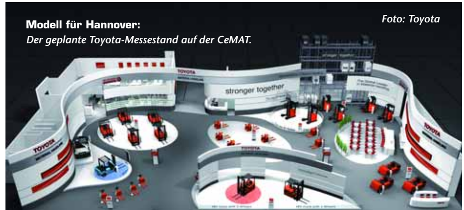
Modell für Hannover: Der geplante Toyota-Messestand auf der CeMAT.

Im Dienstleistungsbereich stellt Toyota eine Reihe von Servicepaketen vor, die dem Kunden maßgeschneiderte Service- und Finanzdienstleistungen aus einer