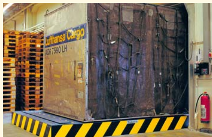
Hoch und hinein: Fahrflächen wie z. B. Kugelbahnen erleichtern den Transport in den Laderaum.

des Lkw zusätzlich in senkrechter Richtung vergrößert. Daher ist mindestens manuell ein Ladeblech aufzulegen. Neue Entwicklungen ermöglichen jedoch wesentlich komfortablere und wirtschaftlichere Lösungen. So können Hubtische mit Klappbrücken aus Aluminium ausgestattet werden, die von einer einzelnen Person leicht zu bedienen sind und dennoch eine großzügige Fahrfläche und Tragkraft aufweisen. Werden viele Güter mit einem Stapler verladen oder auch schwere Güter, so ist es möglich, dass eine elektrohydraulische Schwenkbrücke mit integriertem Voranschub am Hubtisch zum Einsatz kommt. So können alle Vorzüge des sequentiellen und kontinuierlichen Verladeprinzips miteinander kombiniert zum Einsatz kommen, was die maximale Flexibilität und zugleich Effizienz in der Verladezone erlaubt. Welche Variante für den einzelnen Anwendungsfall die beste ist, kann nur in einer Analyse vor Ort geklärt werden.